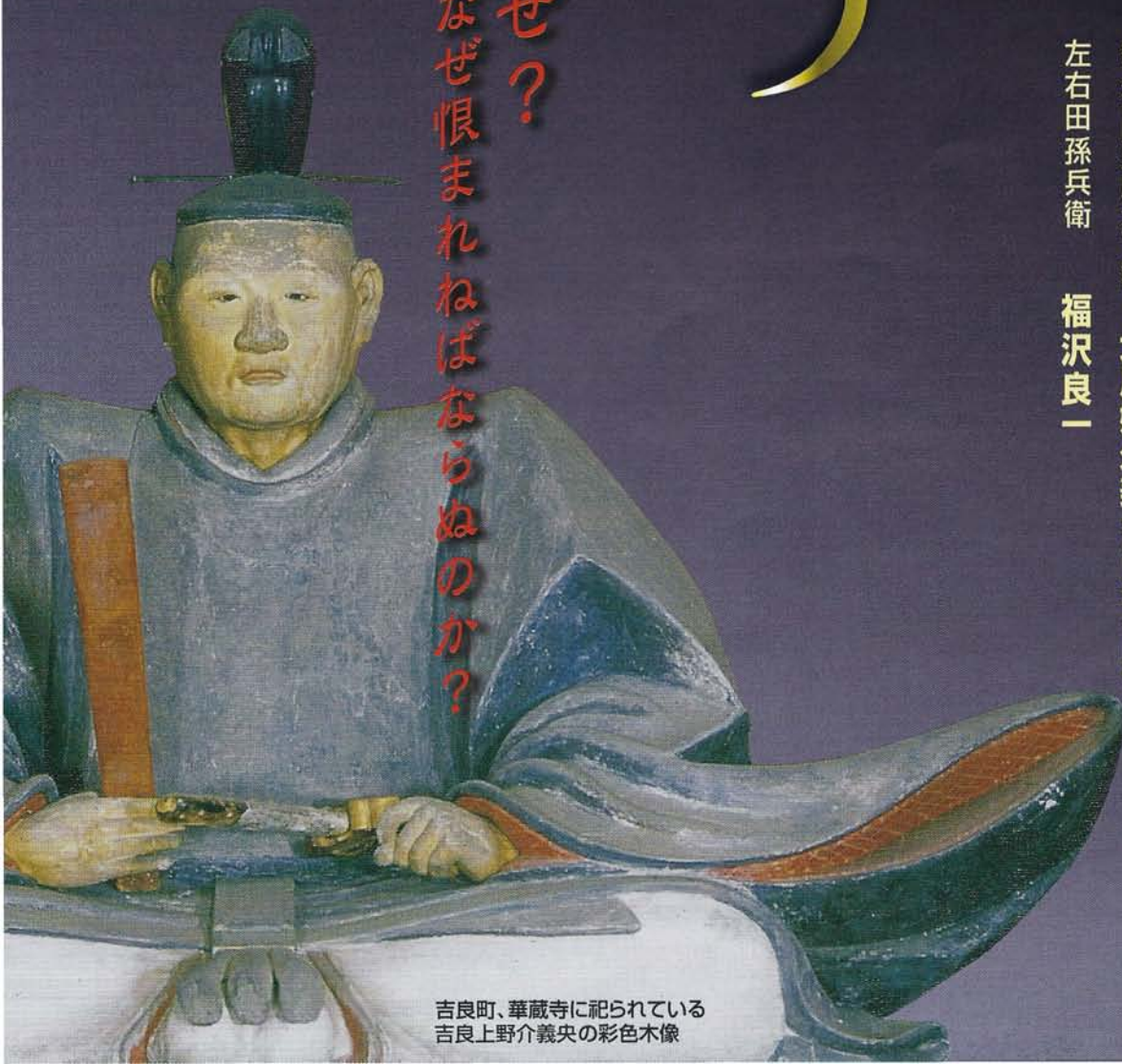
吉良町、華蔵寺に祀られている 吉良上野介義央の彩色木像